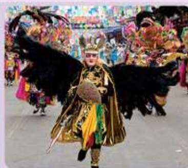
Figura 1.6 Carnaval de Oruro, Bolivia.

Son las distintas formas de vida y manifestaciones de los grupos humanos que generan diversidad en la gastronomía, vestimenta, tradiciones, costumbres, religión, lengua, arquitectura, entre otras manifestaciones artísticas y expresiones culturales.