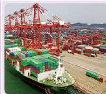
Figura 1.7 Puerto de Qingdao, China.

Incluyen todas las actividades que los seres humanos realizan para obtener bienes y servicios, como la agricultura, la ganadería, la pesca, la explotación forestal, la minería, la industria, el turismo, el comercio y el transporte.