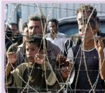
Figura 1.8 Refugiados en la frontera entre Turquía y Siria.

Abarcan las formas de organización social a través de figuras institucionales y de gobierno que administran y dirigen países o territorios. Los límites políticos, las organizaciones internacionales y las guerras son ejemplos de este componente.