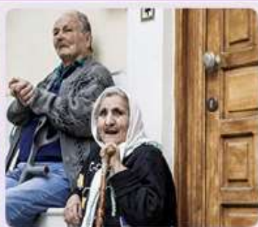
Figura 1.5 Población adulta griega.

Se refieren a la población, sus características y dinámicas; por ejemplo, su crecimiento, composición demográfica, distribución y desplazamientos geográficos.