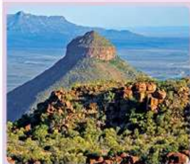
Figura 1.4 Valle de la Desolación, Sudáfrica.

Son los elementos que existen en la superficie terrestre sin la intervención del ser humano, sean seres vivos o no vivos, como el relieve, el clima, el suelo, la vegetación, la fauna y los cuerpos de agua, entre otros.